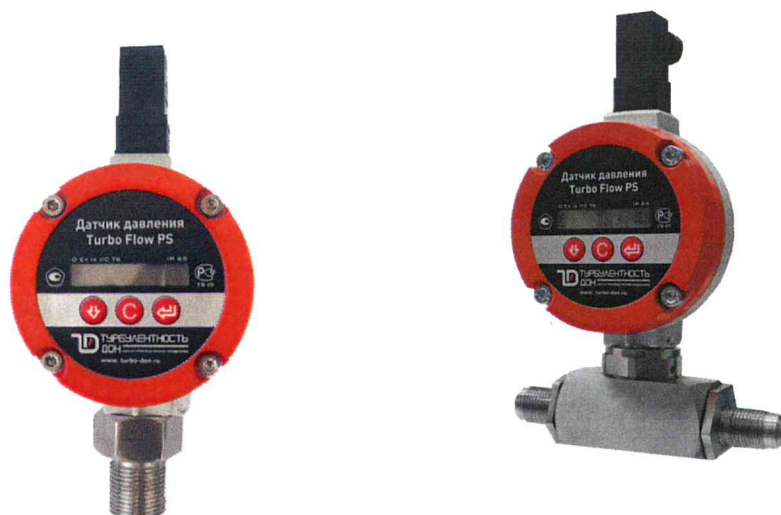
Рисунок 1 - Датчики давления Turbo Flow PS

Внешний вид датчиков давления приведен на рисунке 1.